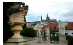
PRAHA 2014 EUROPE BLUES TRAIN FESTIVAL